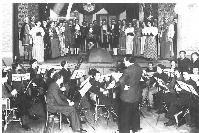
FOTO 15. Nella sala del Caffè Cantoni a Esch-sur-Alzette, dove si rappresenta nel 1934 l'operetta "S'io fossi re", la presenza femminile risulta importante sulla scena.